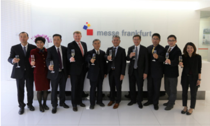
雙方代表為協議的簽訂祝酒慶賀。

北京通聯新里程國際展覽有限公司每年春季於北京主辦 AMR 北京汽保展。通聯新里程以其服務汽保汽修行業多年的專業經驗和豐富的國內外客戶網絡，成功將展會打造成為亞洲最大、世界前三的專業汽保展會之一。2017 年閉幕的展會面積達 110,000 平方米，共有 1,139 家參展企業及 58,212 人次的專業參觀到場。