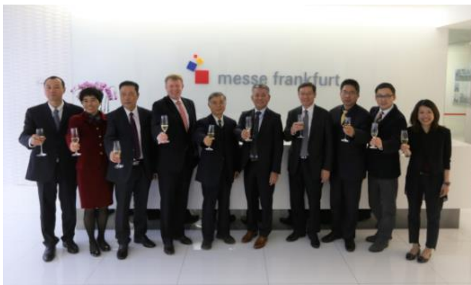
双方代表为协议的签订祝酒庆贺。

北京通联新里程国际展览有限公司每年春季于北京主办 AMR 北京汽保展。通联新里程以其服务汽保汽修行业多年的专业经验和丰富的国内外客户网络，成功将展会打造成为亚洲最大、世界前三的专业汽保展会之一。2017 年闭幕的展会面积达 110,000 平方米，共有 1,139 家参展企业及 58,212 人次的专业参观到场。