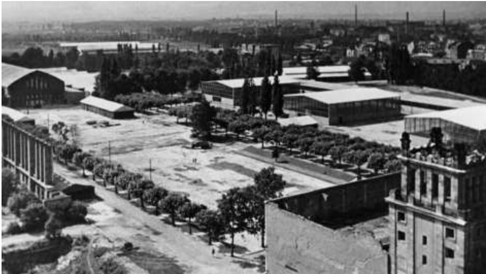
1948年的法蘭克福展覽中心