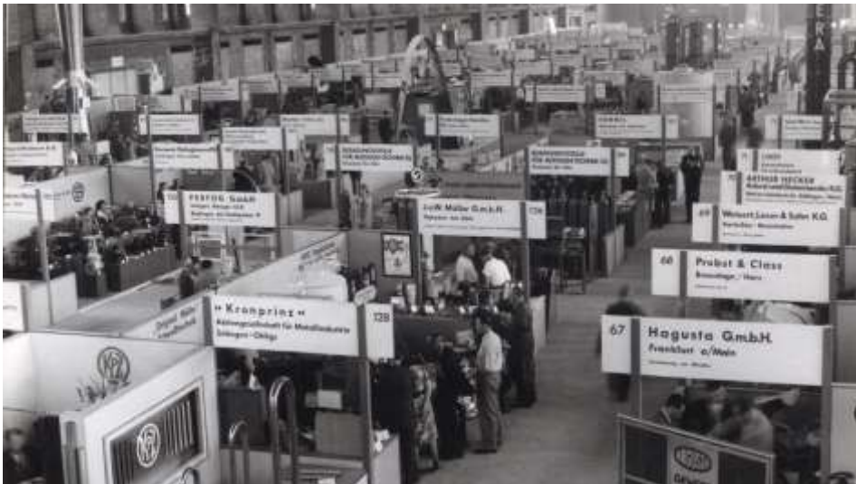
在技術大樓（Haus der Technik）舉辦的首個戰後貿易展覽會的展位展示

通過與整個城市及其市民的密切合作，展覽會順利舉行。已通過檢驗的私人住所為參展商和觀眾提供了12,000張床位，同時展覽會也為集團注入了人才。1948年，集團已擁有2位總經理以及35名員工。