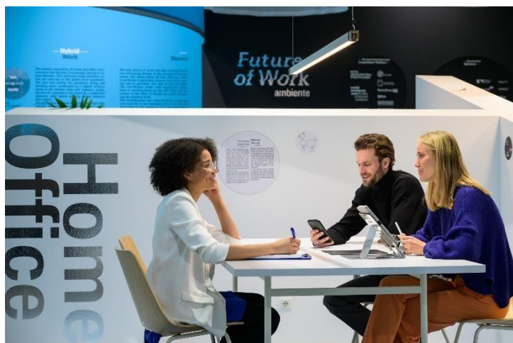
Ambiente 展會新主題：未來工作區域中的新工作模式。