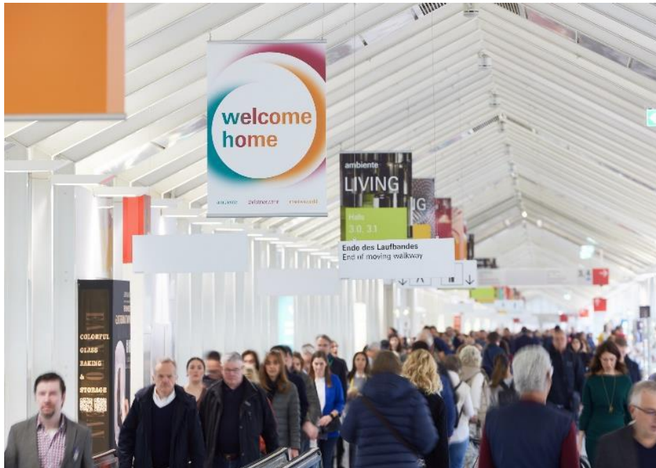
行業人士歡聚法蘭克福參與 2023 年 Ambiente、Christmasworld 及 Creativeworld

法蘭克福展覽集團旗下三大領先消費品展在萬眾矚目中再度回歸，引領消費品行業趨勢潮流，並成為全球消費品市場關注的焦點。在為期 5 天的展覽期間，法蘭克福展覽中心全部展館內充滿了相聚的喜悅以及積極的商貿互動。本屆展會共吸引了 154,000 名專業買家相聚法蘭克福，現場體驗潮流、訂購商品。