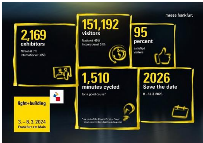
2024 Light + Building 各项展会数据。