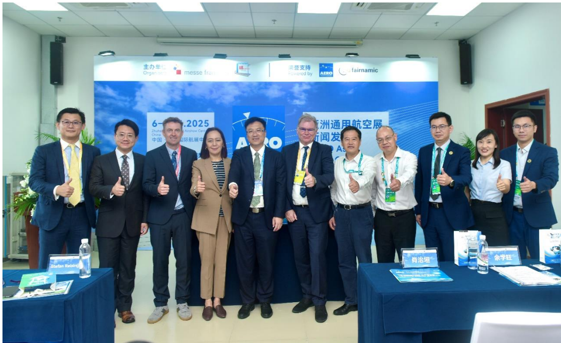
2025 亞洲通用航空展（AERO ASIA）新聞發布會在珠海國際航展中心成功舉行。

2025 亞洲通用航空展（AERO ASIA）新聞發布會於今日成功舉辦，標誌著這一亞洲地區領先的通用航空專業展會的籌備工作全面啟動。來自品牌方、主辦方、參展企業、合作單位的代表和媒體共同見證了這一行業盛事的啟航。