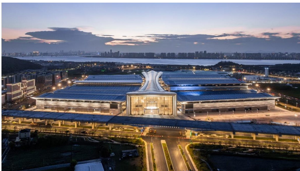
ISSE 国际智慧空间展览会将于杭州大会展中心举行

法兰克福展览集团是最早进入中国市场的国际会展机构之一，自80年代末在中国香港推出首场展览会起，在华举办多场覆盖不同行业板块的展会，影响力遍及京津冀、粤港澳、长三角三大城市群和成渝地区双城经济圈。集团在建筑技术领域积累多年办展经验，并且在全球数字化快速转型的背景下，不断推动前沿智能技术和绿色科技的交流与发展，助力促进行业智能化和可持续发展。伴随着即将举行的ISSE国际智慧空间展览会，集团在中国举办的建筑技术展会将覆盖北京、上海、广州以及杭州这四个重点城市。